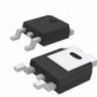
LF80CDT-TRY STMicroelectronics IC REG LDO 8V 0.5A DPAK