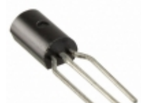
KSA10130BU AMI Semiconductor / ON Semiconductor TRANS PNP 160V 1A TO-92L