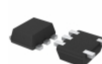
BU4219FVE-TR Rohm Semiconductor IC DETECTOR VOLT 1.9V ODRN 5VSOF