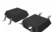
BU4221F-TR Rohm Semiconductor IC DETECTOR VOLT 2.1V ODRN 4SOP