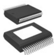
TDA7492ETR STMicroelectronics IC AUDIO AMP CLASS D 36POWERSSO