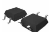
BU4334F-TR Rohm Semiconductor IC DETECTOR VOLT 3.4V CMOS 4SOP