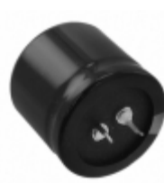
EET-ED2W221EA Panasonic Electronic Components CAP ALUM 220UF 20% 450V SNAP