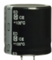
EET-ED2W271DA Panasonic Electronic Components CAP ALUM 270UF 20% 450V SNAP