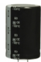
EET-ED2W471EA Panasonic Electronic Components CAP ALUM 470UF 20% 450V SNAP