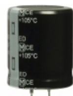
EET-ED2W221DA Panasonic Electronic Components CAP ALUM 220UF 20% 450V SNAP