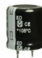
EET-ED2W560BA Panasonic Electronic Components CAP ALUM 56UF 20% 450V SNAP