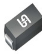
1SMA5936HR3G TSC (Taiwan Semiconductor) DIODE ZENER 30V 1.5W DO214AC