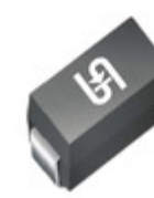
1SMA5936HM2G TSC (Taiwan Semiconductor) DIODE ZENER 30V 1.5W DO214AC