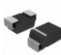
1SMA5936BT3G ON Semiconductor DIODE ZENER 30V 1.5W SMA