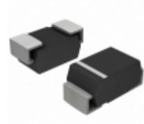
1SMA5937BT3G ON Semiconductor DIODE ZENER 33V 1.5W SMA