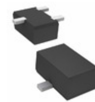
2SD1820A0L Panasonic Electronic Components TRANS NPN 50V 0.5A SMINI 3P