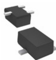
2SD18210RL Panasonic Electronic Components TRANS NPN 150V 0.05A SMINI-3