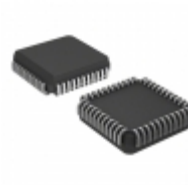
AT27BV4096-12JC Microchip Technology IC OTP 4MBIT 120NS 44PLCC