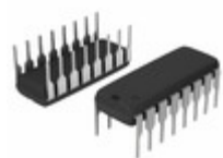
DG542DJ Electro-Films (EFI) / Vishay IC SWITCH QUAD SPST 16DIP