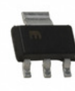
MIC5239-1.5BS Microchip Technology IC REG LDO 1.5V 0.5A SOT223