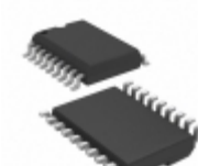
PIC16C620A-04E/SO Microchip Technology IC MCU 8BIT 896B OTP 18SOIC