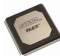
EPF10K20RC240-4N Altera IC FPGA 189 I/O 240RQFP