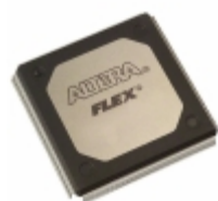
EPF10K20RC240-4 Altera IC FPGA 189 I/O 240RQFP