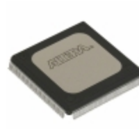
EPF10K20RI208-4 Altera IC FPGA 147 I/O 208RQFP