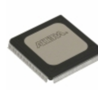
EPF10K20RI208-4N Altera IC FPGA 147 I/O 208RQFP