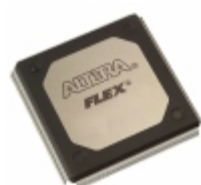
EPF10K20RI240-4N Altera IC FPGA 189 I/O 240RQFP