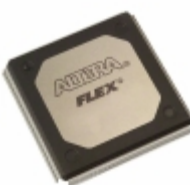
EPF10K20RC240-3N Altera IC FPGA 189 I/O 240RQFP