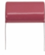
ECQ-E4185KZ Panasonic Electronic Components CAP FILM 1.8UF 10% 400VDC RADIAL