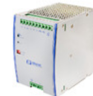
DSA480PS48 XP Power AC/DC CONVERTER 48V 480W