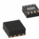
MIC47100-1.2YML-TR Microchip Technology IC REG LDO 1.2V 1A 8MLF