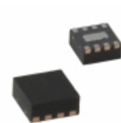
MIC47100-1.2YML-TR Microchip Technology IC REG LDO 1.2V 1A 8MLF