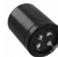
ECE-T1EA473FA Panasonic Electronic Components CAP ALUM 47000UF 20% 25V SNAP