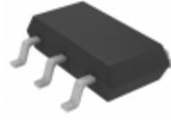
LTC3801ES6#TRMPBF ADI (Analog Devices, Inc.) IC REG CTRLR BUCK TSOT23-6