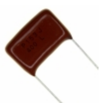
ECQ-P4153JU Panasonic Electronic Components CAP FILM 0.015UF 5% 400VDC RAD