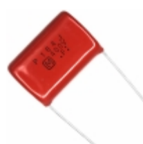
ECQ-P4184JU Panasonic Electronic Components CAP FILM 0.18UF 5% 400VDC RADIAL