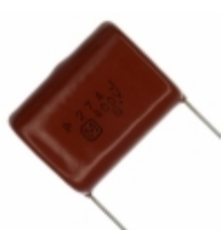
ECQ-P4274JU Panasonic Electronic Components CAP FILM 0.27UF 5% 400VDC RADIAL