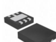
AP7331-20SNG-7 Diodes Incorporated IC REG LDO 2V 0.3A DFN2020-6