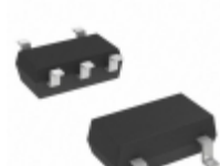
AP7331-30WG-7 Diodes Incorporated IC REG LDO 3V 0.3A SOT25