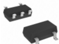
AP7331-18WG-7 Diodes Incorporated IC REG LDO 1.8V 0.3A SOT25