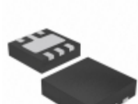
AP7331-18SNG-7 Diodes Incorporated IC REG LDO 1.8V 0.3A DFN2020-6