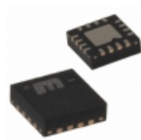
MIC68400-1.0YML TR Microchip Technology IC REG LDO 1V 3A 16MLF