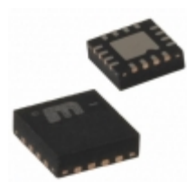
MIC68400-2.5YML-TR Microchip Technology IC REG LDO 2.5V 3A 16MLF