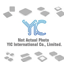
MIC68400-1.8YML MICREL MICREL MLF-16