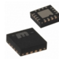
MIC68400-0.8YML TR Microchip Technology IC REG LDO 0.8V 3A 16MLF