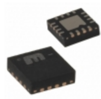
MIC68400-1.8YML-TR Microchip Technology IC REG LDO 1.8V 3A 16MLF