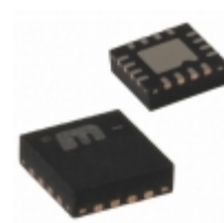
MIC68400-1.8YML-TR Microchip Technology IC REG LDO 1.8V 3A 16MLF