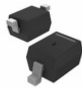
MMDL914-TP Micro Commercial Co DIODE GEN PURP 100V 200MA SOD323