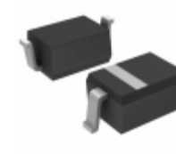
MMDL6050T1G ON Semiconductor DIODE GEN PURP 70V 200MA SOD323