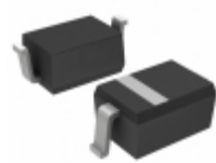
MMDL914T1G ON Semiconductor DIODE GEN PURP 100V 200MA SOD323