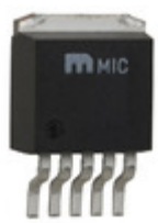
MIC37252BU Microchip Technology IC REG LDO ADJ 2.5A TO263-5