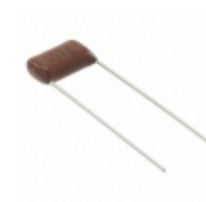
ECQ-E6153JF Panasonic Electronic Components CAP FILM 0.015UF 5% 630VDC RAD