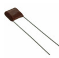
ECQ-E6152JF Panasonic Electronic Components CAP FILM 1500PF 5% 630VDC RADIAL