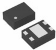
XC6108C27CGR-G Torex Semiconductor Ltd IC SUPERVISOR 2.7V 4-USP