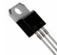
L7905CV STMicroelectronics IC REG LDO -5V 1.5A TO220AB