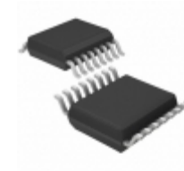
TB6552FNG,C,8,EL Toshiba Semiconductor and Storage IC MOTOR DRIVER PAR 16SSOP