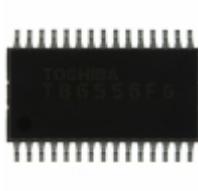
TB6556FG,8,EL,DRY Toshiba Semiconductor and Storage IC MOTOR CONTROLLER PAR 30SSOP