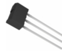
2SB1240TV2R Rohm Semiconductor TRANS PNP 32V 2A ATV