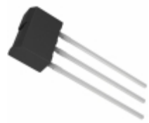
2SB1240TV2Q Rohm Semiconductor TRANS PNP 32V 2A ATV