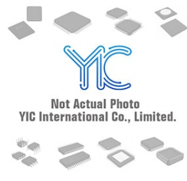
LTC1798CS8-3 LT LTC1798CS8-3 LT