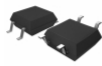
BU4945F-TR Rohm Semiconductor IC VOLT DETECTOR STD 4-SOP