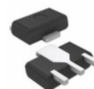
AN77L03M-E1 Panasonic Electronic Components IC REG LDO 3V 0.1A 3HSIP