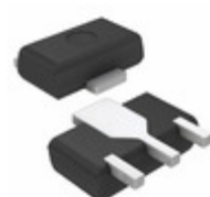
AN77L03M Panasonic Electronic Components IC REG LDO 3V 0.1A 3HSIP