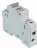
4420.0304 Schurter Inc. CIR BRKR THRM MAG 15A 180 VDC