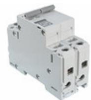
4420.0281 Schurter Inc. CIR BRKR THRM MAG 6A 480V 65V