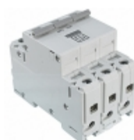
4420.0301 Schurter Inc. CIR BRKR THRM MAG 5A 480V 65V