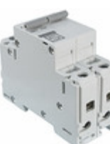
4420.028 Schurter Inc. CIR BRKR THRM MAG 25A 360 VDC