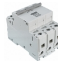
4420.0287 Schurter Inc. CIR BRKR THRM MAG 30A 480V 65V