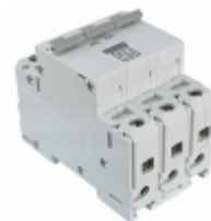
4420.0308 Schurter Inc. CIR BRKR THRM MAG 20A 480V 65V