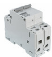
4420.0297 Schurter Inc. CIR BRKR THRM MAG 32A 480V 65V