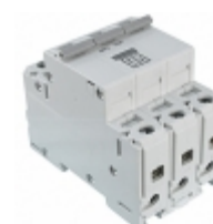
4420.0282 Schurter Inc. CIR BRKR THRM MAG 16A 480V 65V