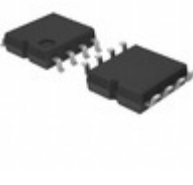
BR25G320F-3GE2 LAPIS Semiconductor SPI BUS EEPROM