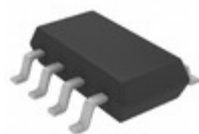
LTC2954CTS8-2#TRMPBF ADI (Analog Devices, Inc.) IC PB ON/OFF CONTROLLER TSOT23-8