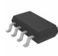
LTC2954CTS8-2#TRPBF ADI (Analog Devices, Inc.) IC PB ON/OFF CONTROLLER TSOT23-8