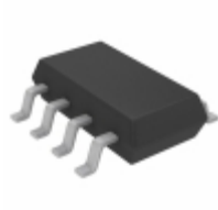
LTC2954CTS8-1#TRMPBF Linear Technology IC PB ON/OFF CONTROLLER TSOT23-8