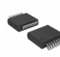
74HC27DB,118 Nexperia USA Inc. IC GATE NOR 3CH 3-INP 14-SSOP