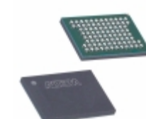
EPC16UC88AA Altera IC CONFIG DEVICE 16MBIT 88UBGA