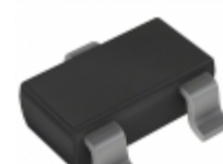
BCX17T116 Rohm Semiconductor TRANS PNP 45V 0.5A SST3