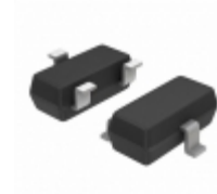
BC849CLT1G ON Semiconductor TRANS NPN 30V 0.1A SOT-23