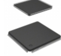
A54SX32A-TQ176I Microsemi Corporation IC FPGA 147 I/O 176TQFP