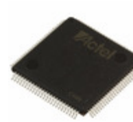
A54SX32A-TQG100M Microsemi Corporation IC FPGA 81 I/O 100TQFP