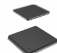
A54SX32A-TQ176 Microsemi Corporation IC FPGA 147 I/O 176TQFP