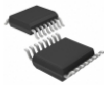
LT6238HGN#PBF Linear Technology IC OP AMP QUAD 215MHZ 16SSOP