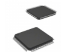
ISPLSI 1032-60LT Lattice Semiconductor Corporation IC CPLD 128MC 20NS 100TQFP