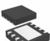
MCP4011T-502E/MC Microchip Technology IC DGTL POT 5K 1CH 8DFN