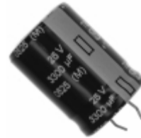
ECE-S1EG332E Panasonic Electronic Components CAP ALUM 3300UF 20% 25V SNAP