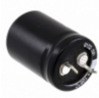
ECE-S1CG472E Panasonic Electronic Components CAP ALUM 4700UF 20% 16V SNAP