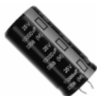
ECE-S1EG103N Panasonic Electronic Components CAP ALUM 10000UF 20% 25V SNAP