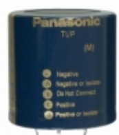
ECE-P2WP821HA Panasonic Electronic Components CAP ALUM 8200UF 20% 450V SNAP