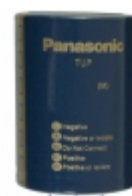
ECE-P2WP152HX Panasonic Electronic Components CAP ALUM 1500UF 20% 450V SNAP