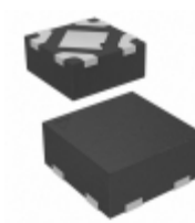
MIC5375-2.8YMT-TR Microchip Technology IC REG LDO 2.8V 0.15A 4TMLF