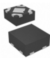
MIC5375-2.8YMT-TZ Microchip Technology IC REG LDO 2.8V 0.15A 4TMLF