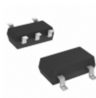
MIC5375-2.8YC5-TR Microchip Technology IC REG LDO 2.8V 0.15A SC70-5