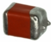
13008-053MESA/HR Electro-Films (EFI) / Vishay CAP TANT 220UF 25V 20% 2917