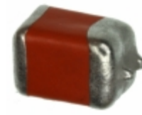
13008-053MESA/HR Vishay Sprague CAP TANT 220UF 25V 20% 2917