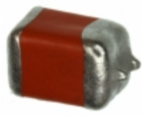
13008-053MESA Vishay Sprague CAP TANT 220UF 25V 20% 2917