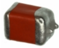
13008-053KESC/HR Vishay Sprague CAP TANT 220UF 25V 10% 2917