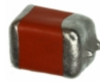
13008-053KESC/HR Electro-Films (EFI) / Vishay CAP TANT 220UF 25V 10% 2917