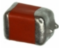
13008-053KESZ Electro-Films (EFI) / Vishay CAP TANT 220UF 25V 10% 2917