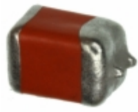
13008-053MESA Electro-Films (EFI) / Vishay CAP TANT 220UF 25V 20% 2917