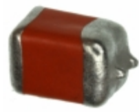
13008-053KESZ/HR Vishay Sprague CAP TANT 220UF 25V 10% 2917