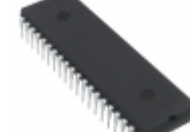
AT89LV52-12PI Microchip Technology IC MCU 8BIT 8KB FLASH 40DIP