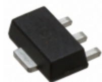
MGA-30689-BLKG Avago Technologies (Broadcom Limited) IC GAIN BLOCK 40DBM LN SOT-89