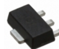
MGA-30489-TR1G Avago Technologies (Broadcom Limited) IC RF AMP DVR 0.25W SOT-89