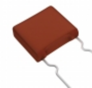
ECW-F2564RJA Panasonic Electronic Components CAP FILM 0.56UF 5% 250VDC RADIAL