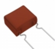
ECW-F2565HAB Panasonic Electronic Components CAP FILM 5.6UF 3% 250VDC RADIAL