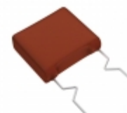
ECW-F2564JAQ Panasonic Electronic Components CAP FILM 0.56UF 5% 250VDC RADIAL