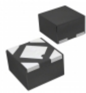
MIC5502-2.8YMT-TZ Microchip Technology IC REG LDO 2.8V 0.3A 4TDFN