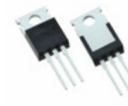
IXFP30N25X3 IXYS Corporation MOSFET N-CHANNEL 250V 30A TO220